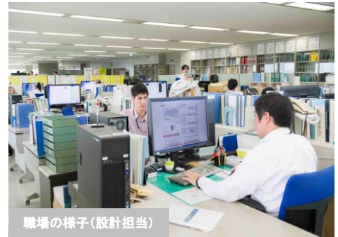
職場の様子（設計担当）