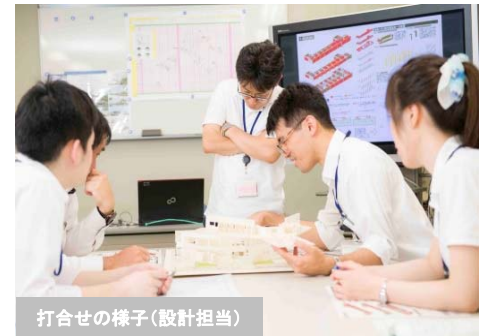
打合せの様子（設計担当）