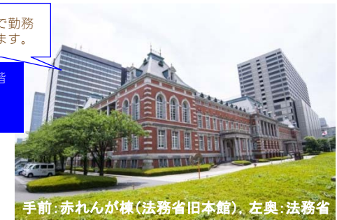
手前：赤れんが棟（法務省旧本館）。左奥：法務省